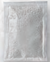
CARGOSORB: Granulatbeutel vor und nach Feuchtigkeitsaufnahme